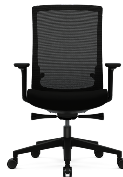
Chaise Ergo (noir)