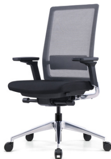
Chaise Active (noir)