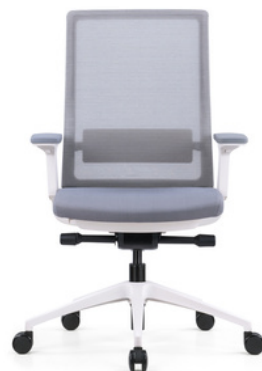
Chaise Active (gris/blanc)