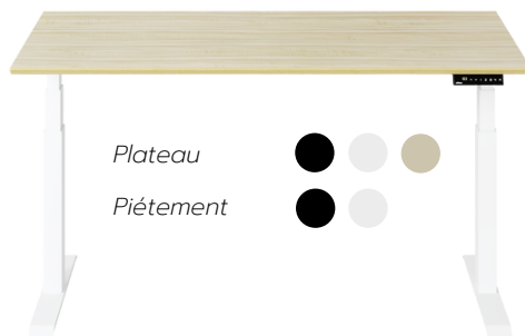
Bureau Elevate réglable en hauteur

Nous sommes toujours là pour vous. N'hésitez pas à tester nos produits pendant 30 jours. S'ils ne vous plaisent pas, vous pouvez les renvoyer gratuitement. Nous offrons également une garantie de 5 ans. Nous sommes à vos côtés à chaque étape et vous pouvez nous contacter à tout moment.