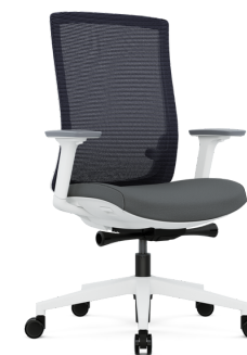
Chaise Ergo (gris/blanc)